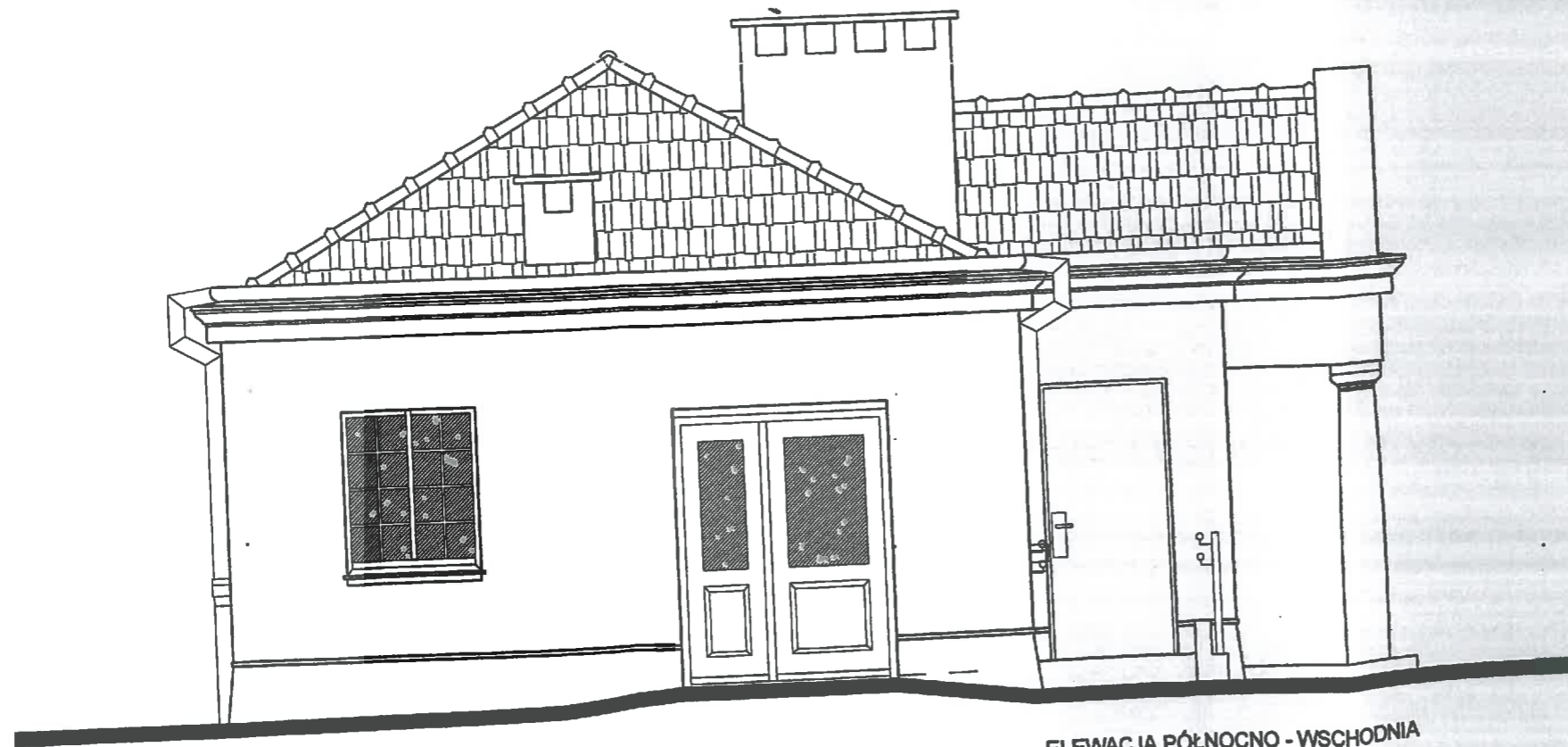
ELEWACJA PÓLNOCCO - WSCHODNIA